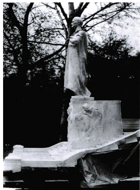
Denkmal-Entwurf im Maßstab 1:10 von 1911 (Modell verloren)

Der geerbte Fundus des Klinger-Entwurfes besteht vorrangig aus einer losen Reihe von Fotos der Gipsstudien und Skizzen aus unterschiedlichen Schaffensetappen. Die ursprünglichen Gipsmodelle einschließlich das repräsentative 1:10-Denkmalmodell mit Treppe von 1911 sind verloren. Lediglich eine 80cm große Gipsstudie von 1907 bewahrt das Museum der bildenden Künste auf. Bereits nach dem Tod Klingers wurde es von den Kunstverantwortlichen der Stadt als unmöglich erachtet, auf dieser Grundlage das Denkmal fertigzustellen. Diese Einschätzung gilt auch heute. Eine künstlerische Nachahmung wäre ein fragwürdiges Unterfangen, welches der Stadt Leipzig als Kunst- und Kulturmetropole schadet. Dieses lässt nur die Option zu, mit einer neuen und zeitgemäßen Wagner-Darstellung den Klinger-Sockel zu vollenden.