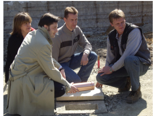
Umweltbürgermeister Heiko Rosenthal bei der Grundsteinlegung

Mit der Aufstellung des Denkmalsockels ist ein wichtiger Meilenstein für unsere Denkmalrealisierung erreicht. Die Verknüpfung der zeitgemäßen Wagner-Darstellung mit dem wiedererrichteten Klinger-Relikt wird den Bogen einer über 100-jährigen Leipziger Wagner-Denkmalgeschichte schließen. Bleibt nun noch das Folgeprojekt, das gesamte Areal durch einen Abriss des im Rücken des Denkmals befindlichen 70er-Jahre-Gebäudes frei zu machen und durch eine passende Neugestaltung einen attraktiven Leipzig-Ort zu schaffen. Dergleichen deutete Heiko Rosenthal in seiner Festansprache bereits an.